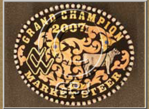
2006 National Western